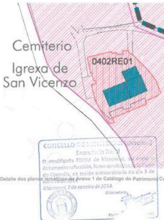
Detalle dos plans temáticos de Anexo 1 do Catálogo do Patrimonio Cultural.